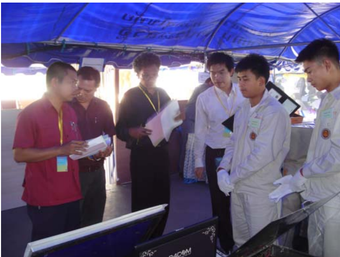
คณะกรรมการตรวจให้คะแนนผลงานสิ่งประดิษฐ์