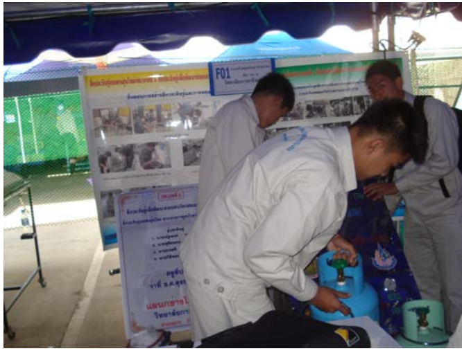
นักเรียนทำการติดตั้งผลงานสิ่งประดิษฐ์