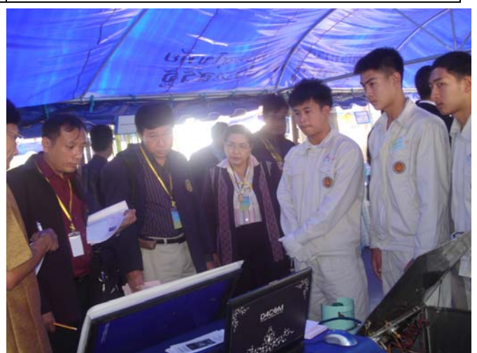
คณะกรรมการตรวจให้คะแนนผลงานสิ่งประดิษฐ์